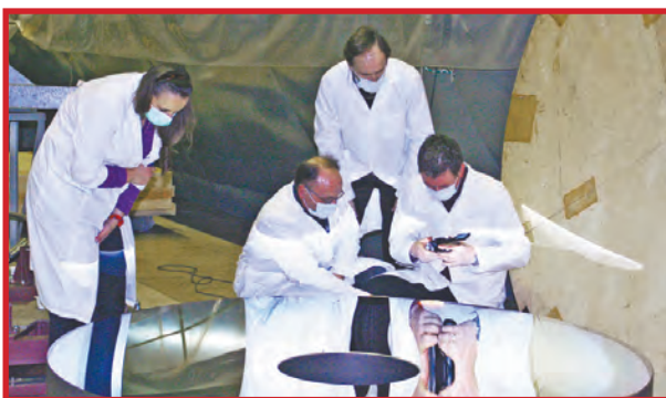
ЛАЗЕРНЫЕ СИСТЕМЫ – НА ОБОРОНУ РОССИИ