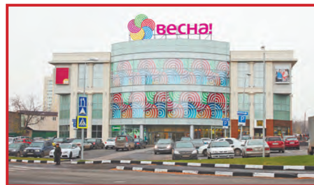
«ВЕСНУ» ОТКРЫЛИ ОСЕНЬЮ