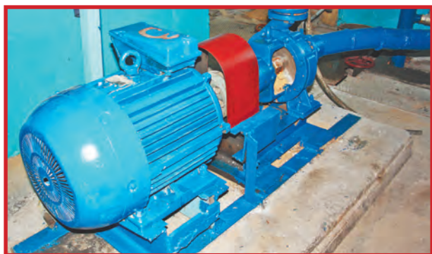
ВСЕГДА И ВЕЗДЕ – ВЕЧНАЯ СЛАВА ВОДЕ!