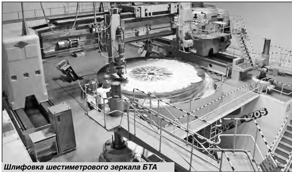
Шлифовка шестиметрового зеркала БТА

Валерий АГЕЕВ, специальный корреспондент