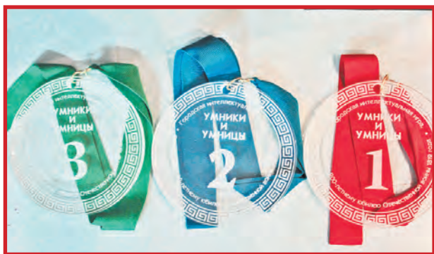
ПОДВЕДЕНЫ ИТОГИ ИГРЫ «УМНИКИ И УМНИЦЫ»