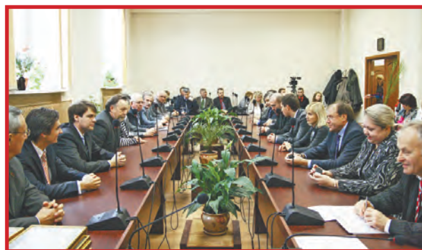
«ПРОБЛЕМЫ РЕШАЕМ СООБЩА»