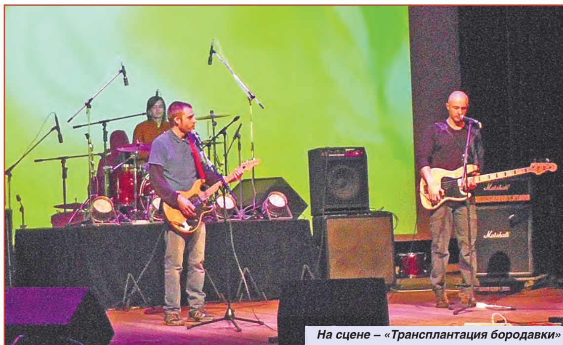
На сцене – «Трансплантация бородавки»