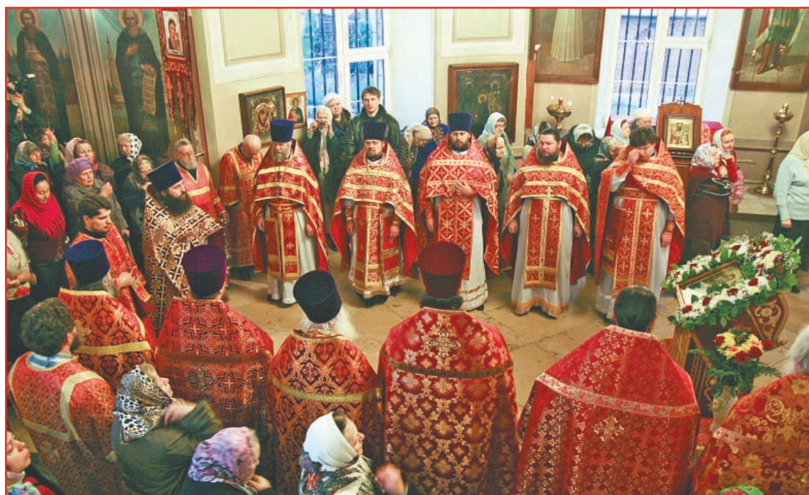
Божественная литургия с молебном святому небесному покровителю Лыткарина в Петропавловском храме, 19 ноября, 2012 год