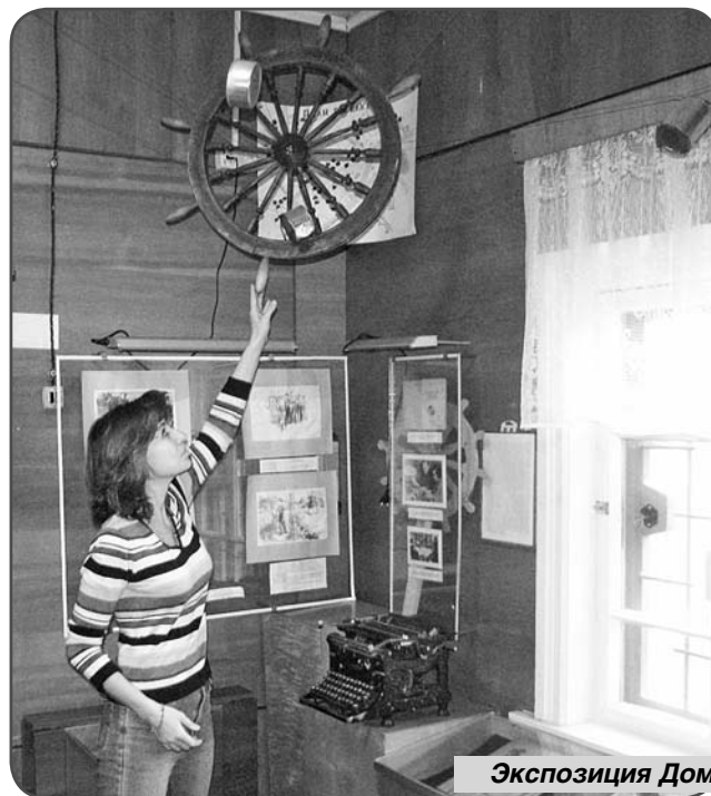
Экспозиция Дома-музея Аркадия Гайдара