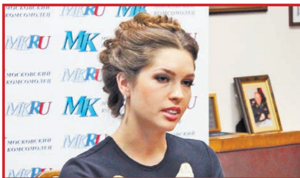
ЭТАЛОН РОССИЙСКОЙ КРАСОТЫ