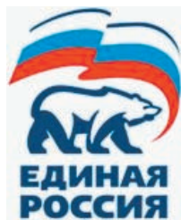
График приема населения (местное отделение ВПП «Единая Россия»)