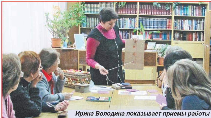
Ирина Володина показывает приемы работы

Анна СПАРЫШКИНА, научный сотрудник краеведческого отдела ЦГБ.