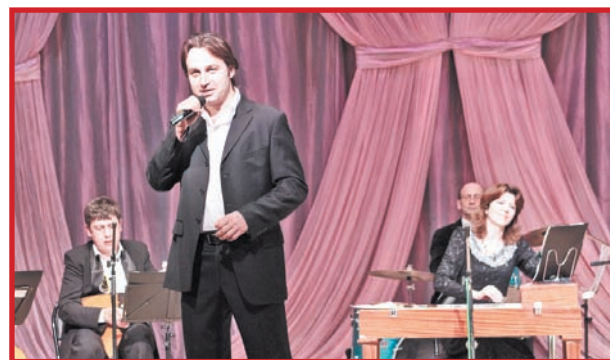
«МЫ ТАК БЛИЗКИ, ЧТО СЛОВ НЕ НУЖНО»