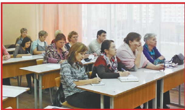
РЕСУРСНЫЙ ЦЕНТР – В ДЕЙСТВИИ