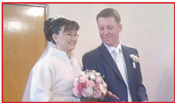
ЧИСЛО 12 СЧАСТЬЕ ПРИНЕСЕТ!