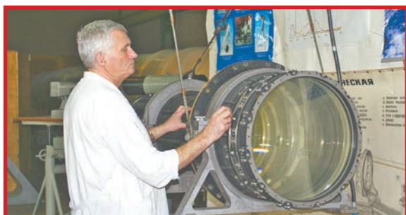
ЛЗОС – УЧАСТНИК МИРОВЫХ ПРОЕКТОВ