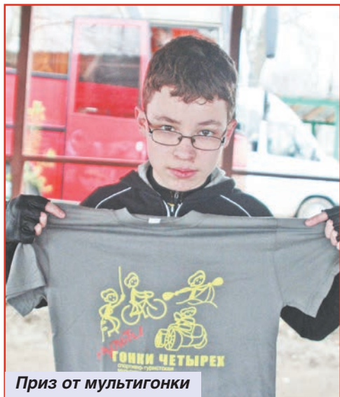
Приз от мультигонки

Снаряжения нужно много, первый класс – самый простой, участники с собой веревку не несут, на них индивидуальная страховочная система и некоторое количество железного оборудования: карабины, восьмерки и жумары. Это все стоит довольно дорого, и никто из моих детей своего снаряжения не имеет. Нам идут на помощь наши друзья из Жулебино. Мы им помогаем – организовываем тренировки по ориентированию, я лично занимаюсь с их детьми, а они