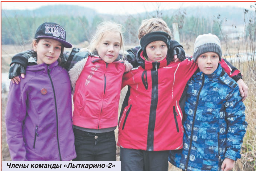
Члены команды «Лыткарино-2»