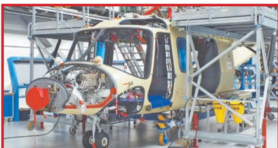
СОТРУДНИЧЕСТВО С AGUSTA