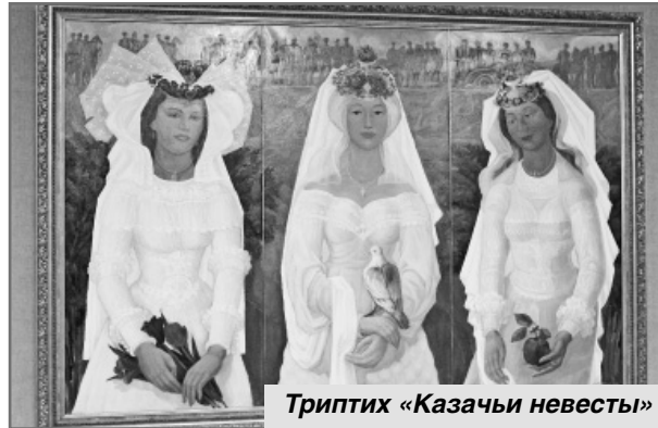
Триптих «Казачьи невесты»

Вот уже на протяжении многих лет на фасаде больничного комплекса можно видеть рельеф «Материнство», выполненный Василием Бабенко, который вызывает у каждой матери, входящей в это здание, хорошее настроение и надежду на лучшее будущее. Автором были также выполнены многие художественные