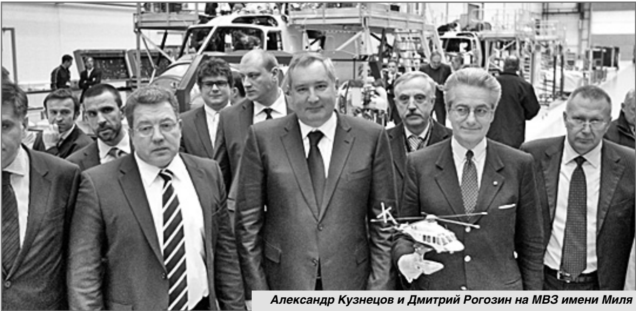
Александр Кузнецов и Дмитрий Рогозин на МВЗ имени Миля

Российско-итальянское производство набирает обороты