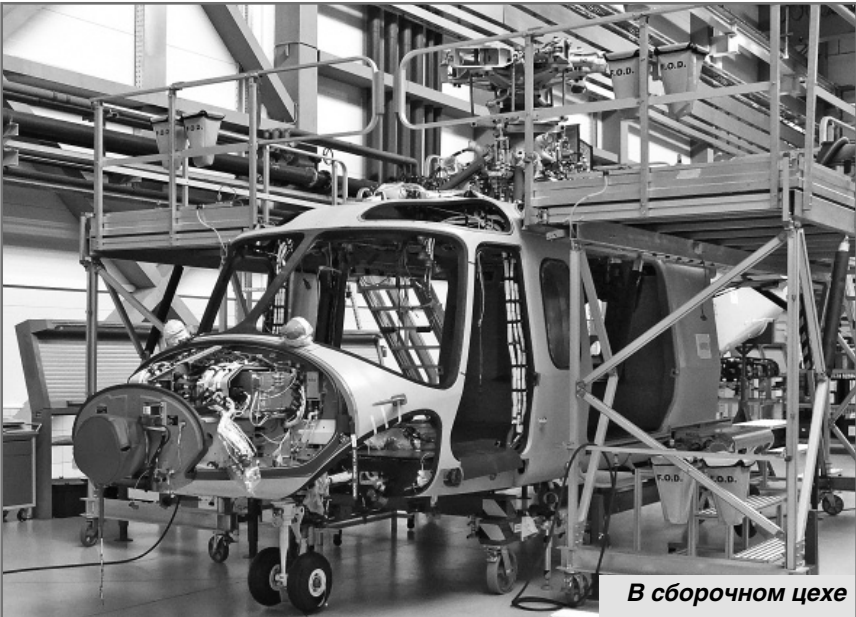
В сборочном цехе