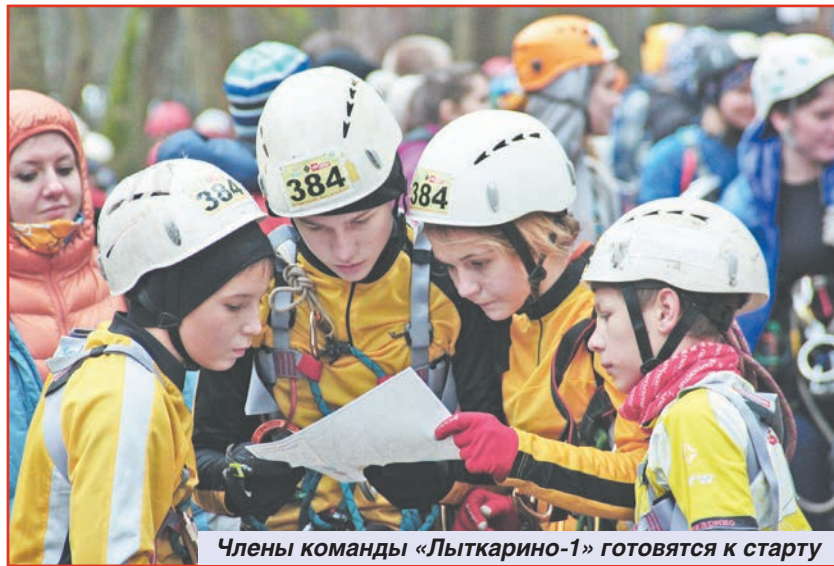
Члены команды «Лыткарино-1» готовятся к старту