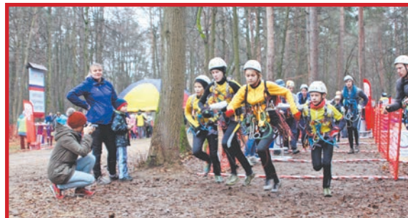
ПОКОРЯЕМ НОВЫЕ ВЕРШИНЫ