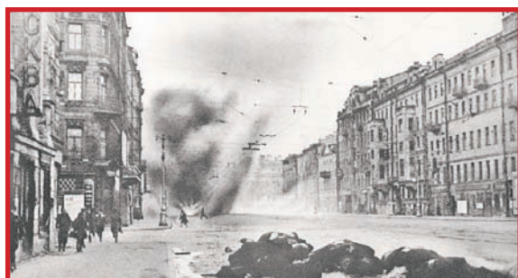
МЫ ПОМНИМ ТЕБЯ, ЛЕНИНГРАД