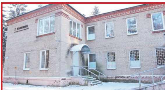
В ЛЫТКАРИНО ПОСТРОЯТ НОВУЮ ПОЛИКЛИНИКУ