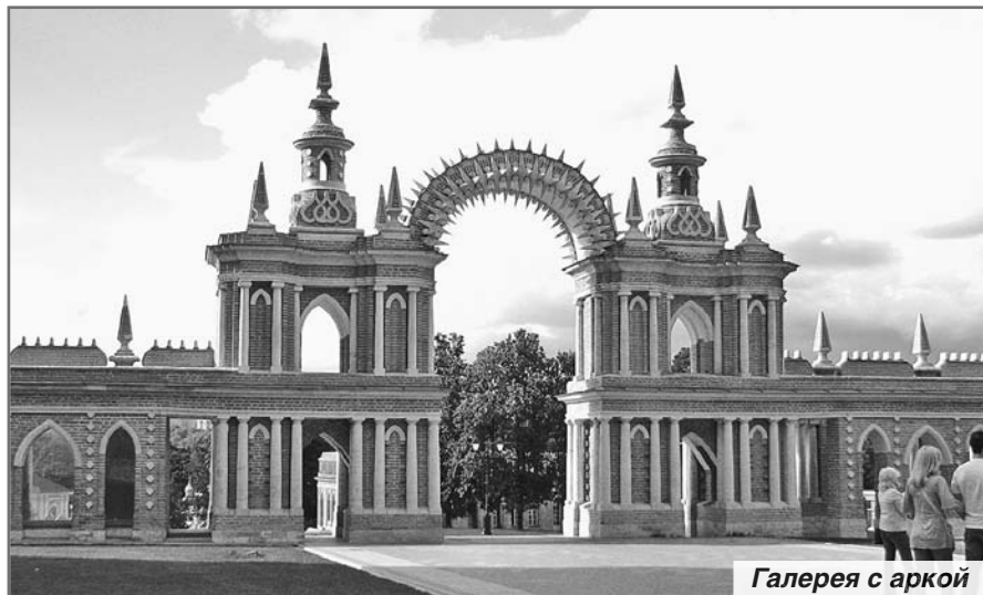
Галерея с аркой

Практически напротив дворцового ансамбля неподалеку друг от друга расположены три Кавалерских корпуса, которые, по всей видимости, предназначались для дворцовой прислуги. Архитектура этих зданий более скромная, но отлично сочетается с главными постройками усадьбы. Элегантные колонны из красного кирпича и расположенные над ними фронтоны с декоративным убранством в виде звезд, лучей и трилистников отличаются особой