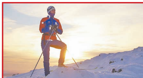
ПОБЕДУ ПОСВЯЩУ «ЛВ»